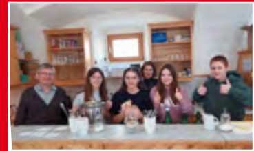
Fastensuppe Firmlinge, S.11