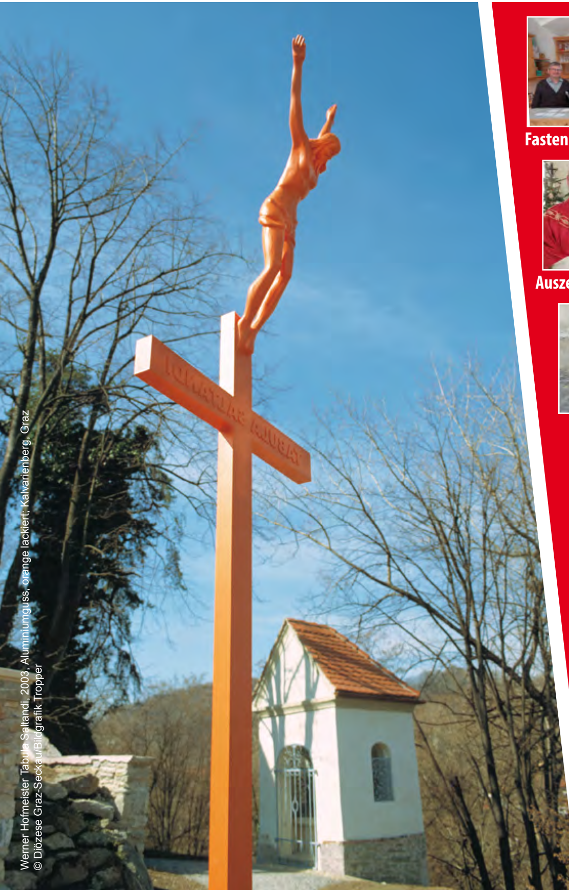
Werner Hofmeister Tabula Saltandi, 2003, Aluminiumguss, orange lackiert, Kalvarienberg, Graz