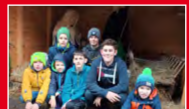
Hl. Abend, Friedenslicht, S.19